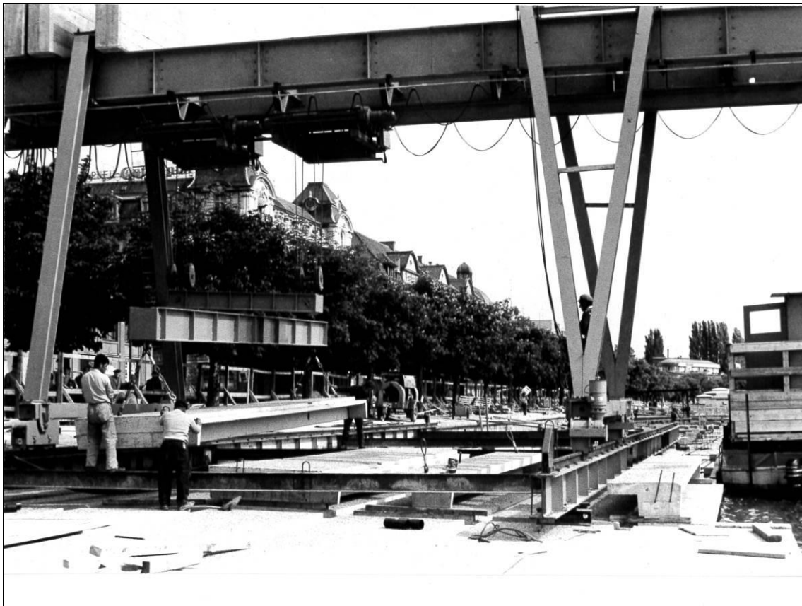
Setzung der vorfabrizierten Abdeckplatten mittels mobilem Kran (Aufnahmedatum:1970). Dieser Kran konnte nach Beendigung des Auftrags auf dem Werkhof Dällikon installiert werden. Bis heute verrichtet er zuverlässig seinen Dienst.