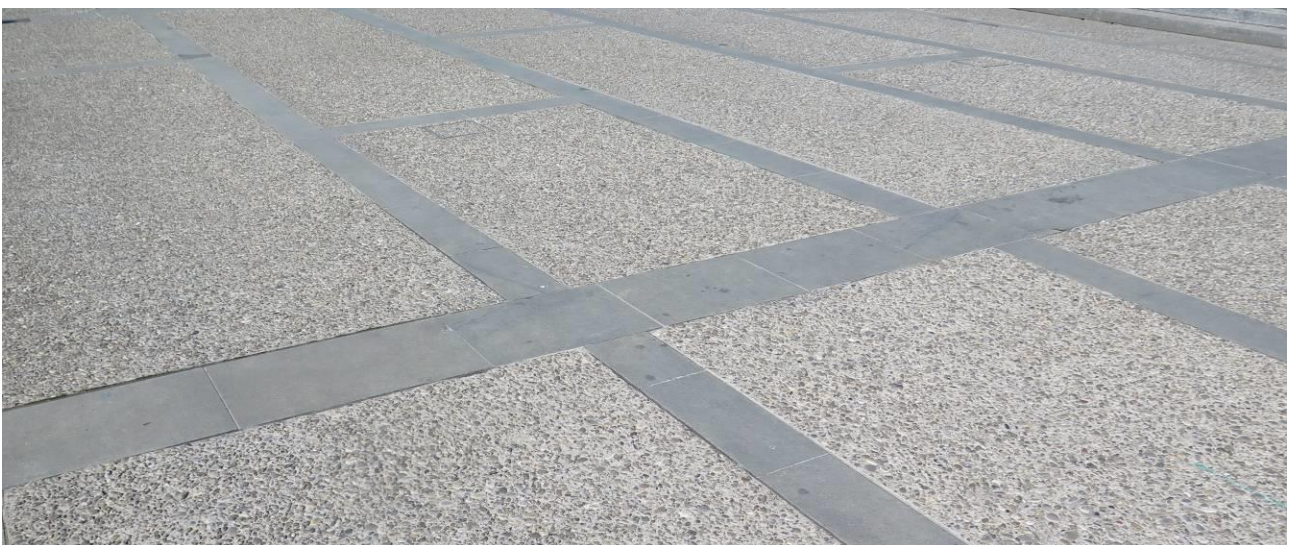
Aufnahmedatum der Fotos: 28. März 2017