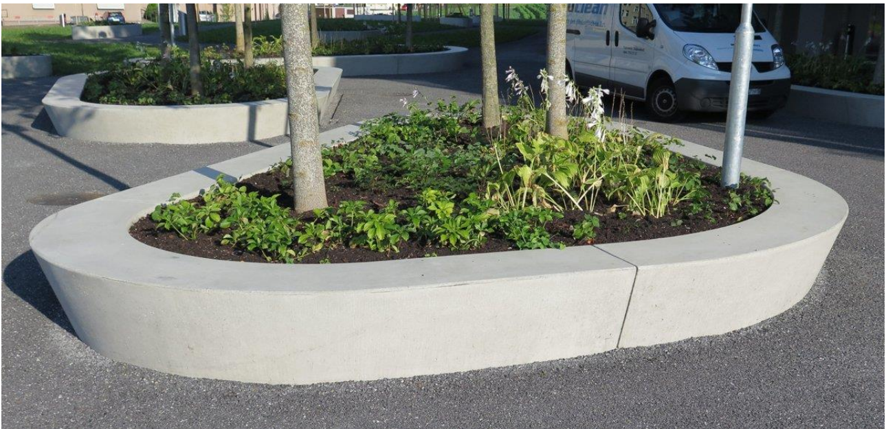
Pflanzeninseln mit Betonelementen von STÜSSI.